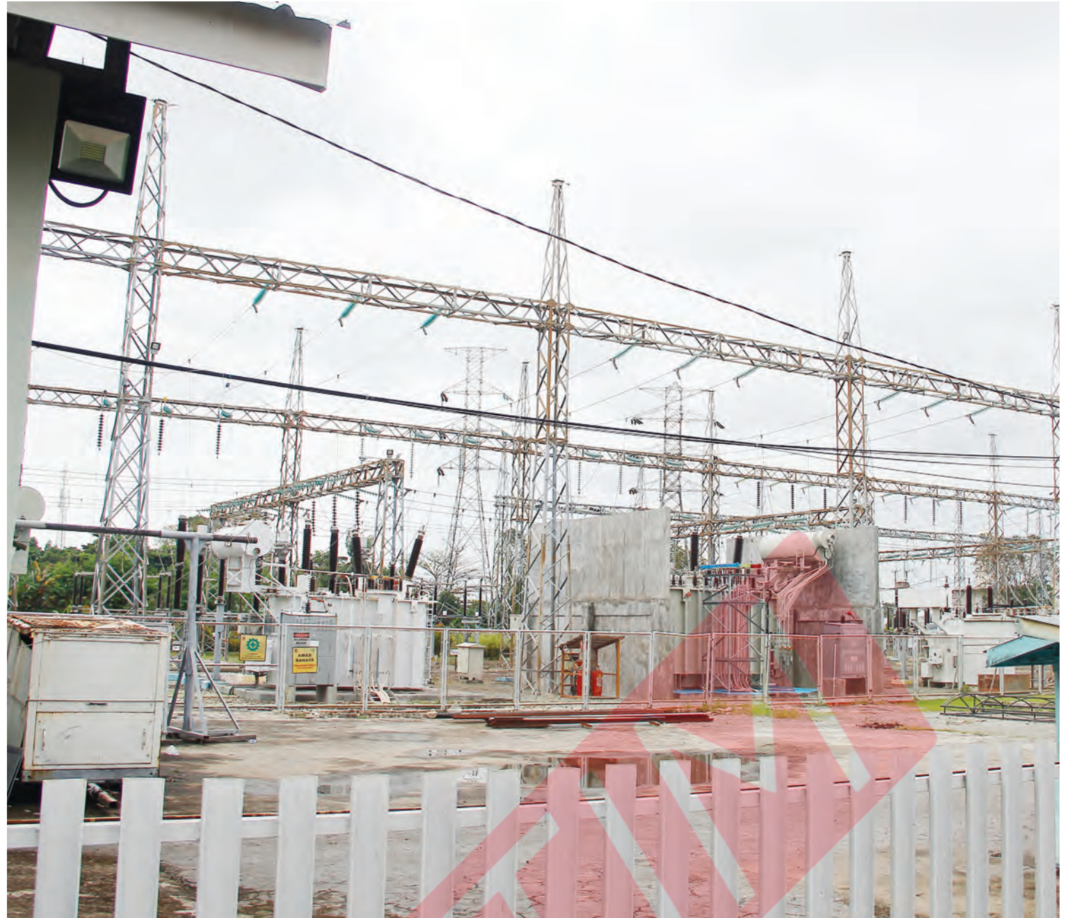
Pembangkit Listrik Tenaga Diesel (PLTD) Batak, Balikpapan, saat ini menjadi cadangan PLN Kaltimra jika terjadi masalah dalam jaringan. Pembangkit ini dinilai lebih besar biaya operasionalnya lantaran menggunakan bahan bakar minyak.