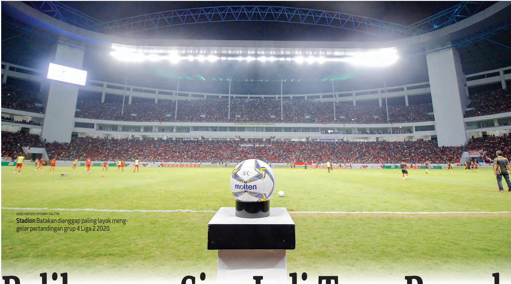
Stadion Batakan dianggap paling layak menggelar pertandingan grup 4 Liga 2 2020.