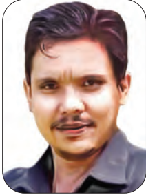
OLEH: CHEHOB HELMI

LEBIH penting mana helm atau masker? Mungkin banyak yang menjawab helm. Namun dalam situasi saat ini ada yang menjawab masker. Atau malah ada yang menjawab keduanya penting.