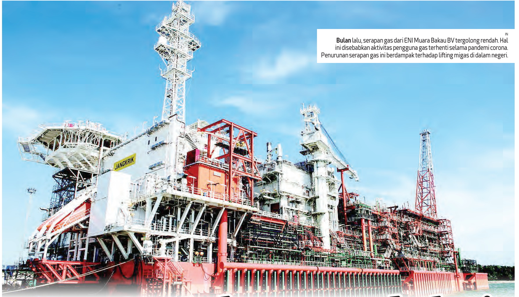
Bulan lalu , serapan gas dari ENI Muara Bakau BV tergolong rendah. Hal ini disebabkan aktivitas pengguna gas terhenti selama pandemi corona. Penurunan serapan gas ini berdampak terhadap lifting migas di dalam negeri.

Dia menambahkan, untuk memastikan kebutuhan energi terpenuhi, Pertamina tetap menyediakan BBM di seluruh wilayah sesuai permintaan. (de/qn)