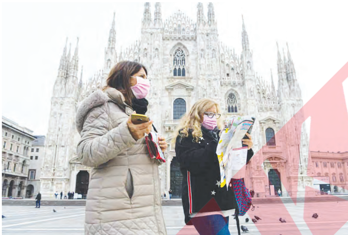
Eropa mencatat penularan virus corona terparah setelah Amerika. Sejuah ini, dari 10 juta orang yang terjangkit COVID-19, sebanyak 25 persen di antaranya berasal dari Eropa. Gelombang kedua penyebaran virus mematikan ini sedang menjangkiti warga di beberapa negara di Benua Biru.