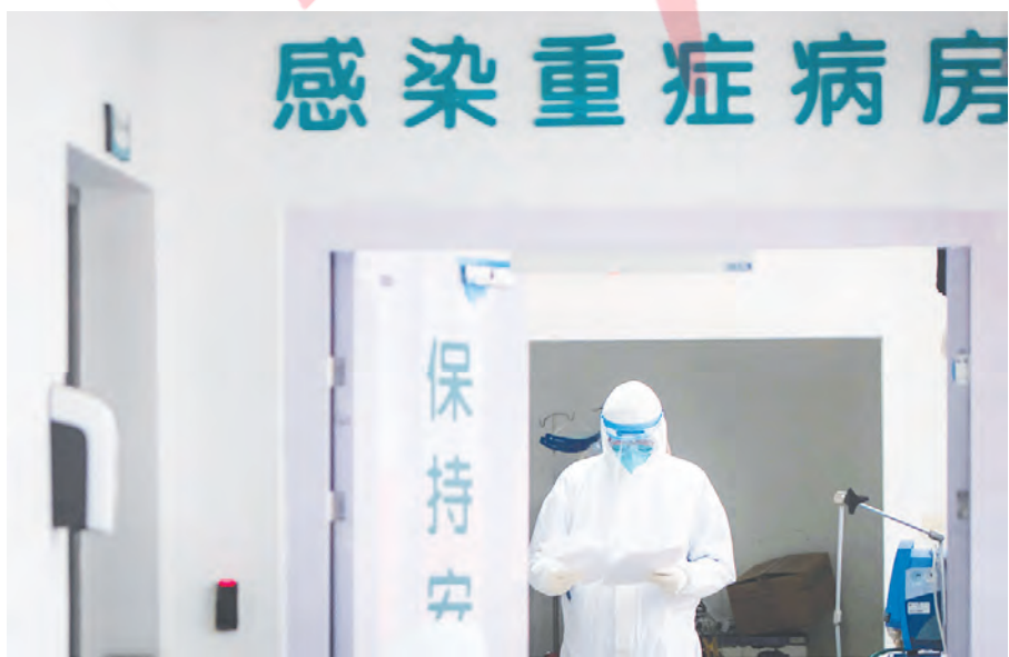
Ilmuwan Tiongkok menjadi yang terdepan dalam menciptakan vaksin virus corona. Vaksin yang diuji sejumlah perusahaan yang berada di bawah naungan pemerintah Tiongkok telah menunjukkan hasil positif dalam percobaan uji klinis.

Hingga kini, pemerintah Indonesia belum menentukan bagaimana penanganan para pengungsi ini untuk jangka panjang. (sr/qn)