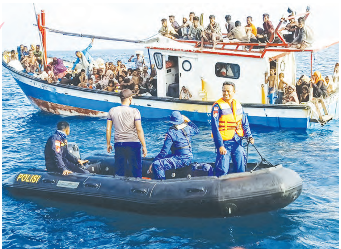
Aparat gabungan menyematkan para pencari suaka yang berasal dari Rohingya. Saat ini, mereka mendapatkan tempat tinggal sementara di Aceh.

CNGB mengatakan, pihaknya akan menjalankan Fase 3 untuk calon vaksinnya di Uni Emirat Arab. Tanpa merinci eksperimen mana yang akan diuji. (an/qn)