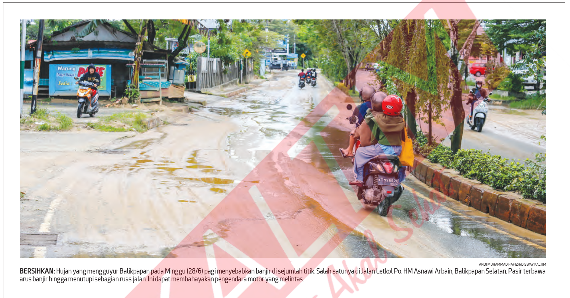
BERSIHKAN: Hujan yang mengguyur Balikpapan pada Minggu (28/6) pagi menyebabkan banjir di sejumlah titik. Salah satunya di Jalan Letkol Po. HM Asnawi Arbain, Balikpapan Selatan. Pasir terbawa arus banjir hingga menutupi sebagian ruas jalan. Ini dapat membahayakan pengendara motor yang melintas.