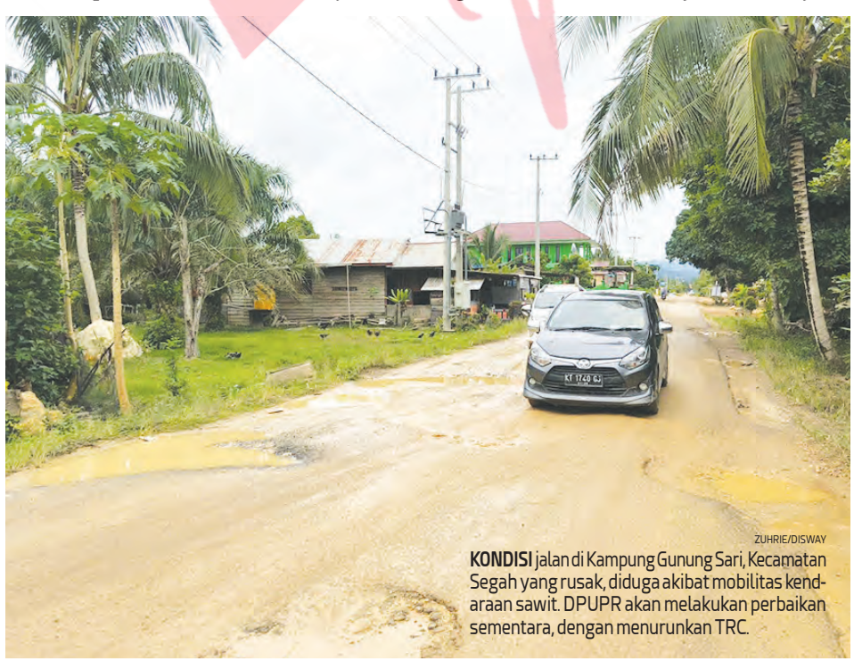
KONDISI jalan di Kampung Gunung Sari, Kecamatan Segah yang rusak, diduga akibat mobilitas kendaraan sawit. DPUPR akan melakukan perbaikan sementara, dengan menurunkan TRC.

“Dalam satu hari sudah ada minimal 3 kali penerbangan rutin dari total 22 penerbangan setiap harinya. Kami harap kondisi ini segera berakhir, agar ekonomi Kalimarau dan khususnya Berau kembali normal,” harapnya. (* /zuh/app)