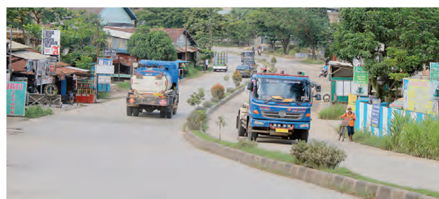
Di Jalan Rapak Indah, Kecamatan Sungai Kunjang ini, sering terjadi kecelakaan lalu lintas. Utamanya saat malam hari. Seperti yang terjadi baru-baru ini. Di kawasan itu, tak tampak lampu penerangan jalan.

Mendapat laporan tersebut, Unit Lakalantas segera menuju ke lokasi kejadian untuk langsung melakukan olah TKP, mencari keterangan saksi dan mengamankan sejumlah barang bukti, yakni kendaraan yang terlibat