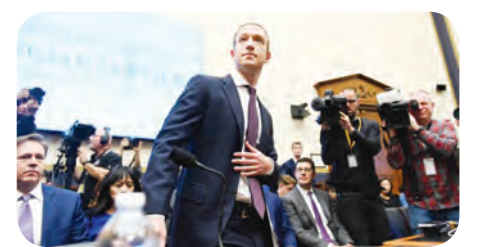
Pendiri sekaligus CEO Facebook Mark Zuckerberg.