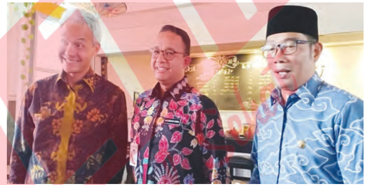
Gubernur DKI Jakarta Anies Baswedan, Gubernur Jawa Tengah Ganjar Pranowo, dan Gubernur Jawa Barat Ridwan Kamil membukukan elektabilitas tertinggi dibandingkan beberapa kepala daerah yang masuk bursa pencalonan di Pilpres 2024.

Secara umum, faktor kinerja dan kepemimpinan yang merakyat serta terukur menjadi kunci keberhasilan Ganjar dan Kang Emil dalam meraih dukungan publik. "Sebaliknya sosok seper-