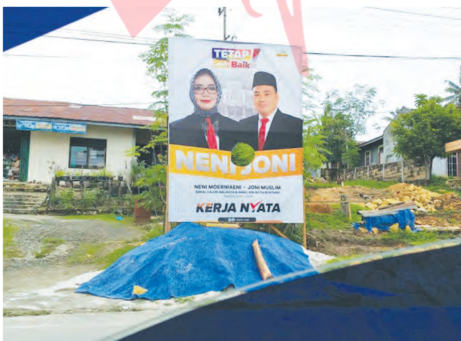
Baliho Neni-Joni yang dirusak oknum. Perusakan ini adalah kali kedua yang sebelumnya terjadi Januari lalu.