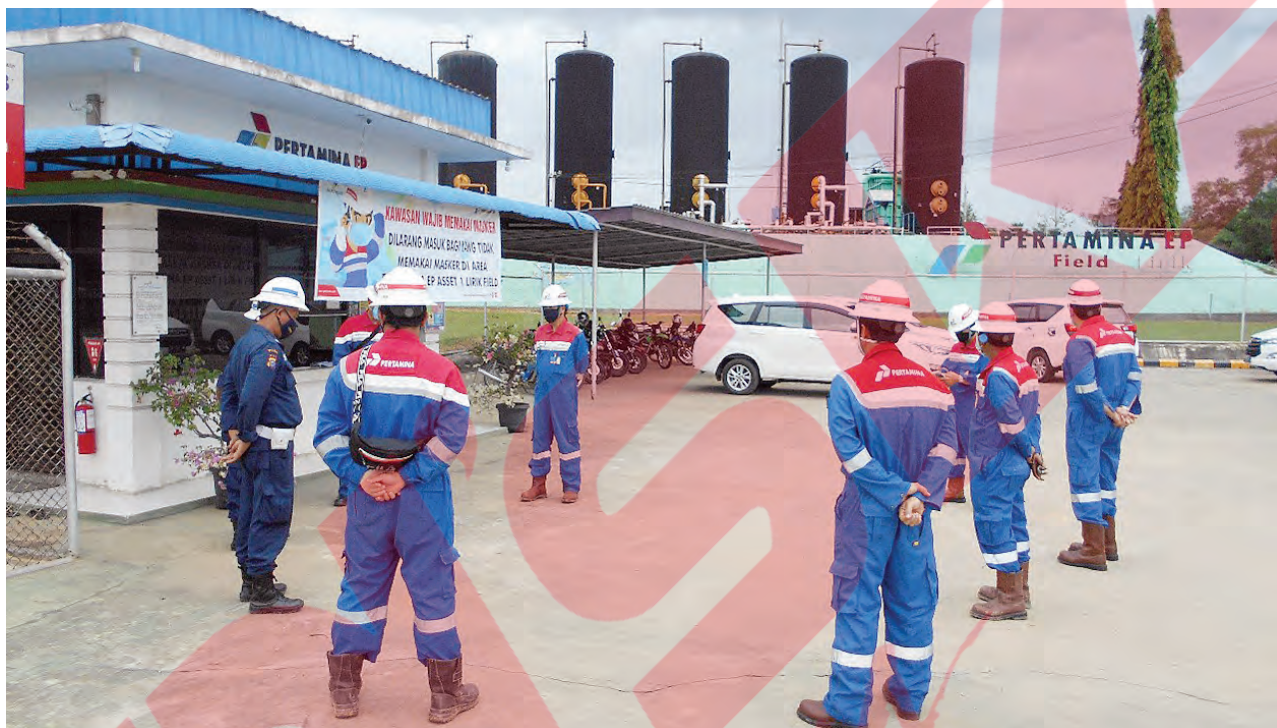
Para pekerja di PT PEP bersiap menjalankan tugas di tengah pandemi corona. Mereka menerapkan protokol kesehatan selama berada di areal perusahaan tersebut.

Serapan gas oleh pembeli domestik terutama PT PLN (Persero) juga turun. Hal yang sama terjadi pada sektor industri pada Mei 2020. Yang masih disebabkan oleh pandemi COVID-19. Yang berdampak terhadap terbatasnya pergerakan barang dan orang. Sehingga banyak pabrik mengurangi kegiatan operasinya atau bahkan harus menghentikan produksi sementara. Hal tersebut berdampak terhadap berkurangnya konsumsi energi pada sektor industri. Penurunan kebutuhan energi pada industri, komersial, dan perkantoran selama COVID-19 ini juga berdampak terhadap kebutuhan energi dari PLN. (de/qn)