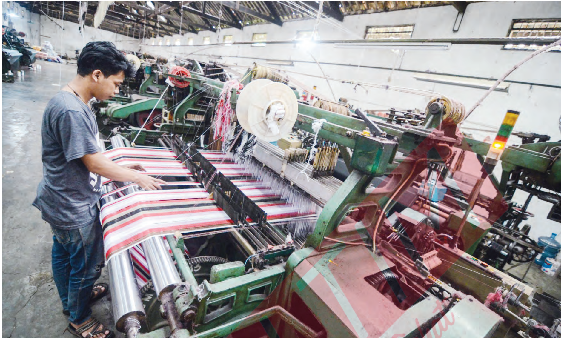
Pemerintah pusat menggelontorkan dana senilai Rp 53,57 triliun. Untuk menopang keuangan perusahaan-perusahaan. Yang terdampak pandemi corona. Namun dana ini belum sepeser pun terserap di dunia usaha. Pasalnya, pemerintah menghadapi tantangan di level operasional dan proses administrasi.

Untuk program UMKM senilai Rp 123,46 triliun, realisasinya mencapai 22,74 persen atau Rp28 triliun. Yang telah dimanfaatkan untuk subsidi bunga KUR maupun non-KUR serta penempatan dana di bank Himbara. Untuk pembiayaan korporasi senilai Rp 53,57 triliun. Insentif ini bahkan be-