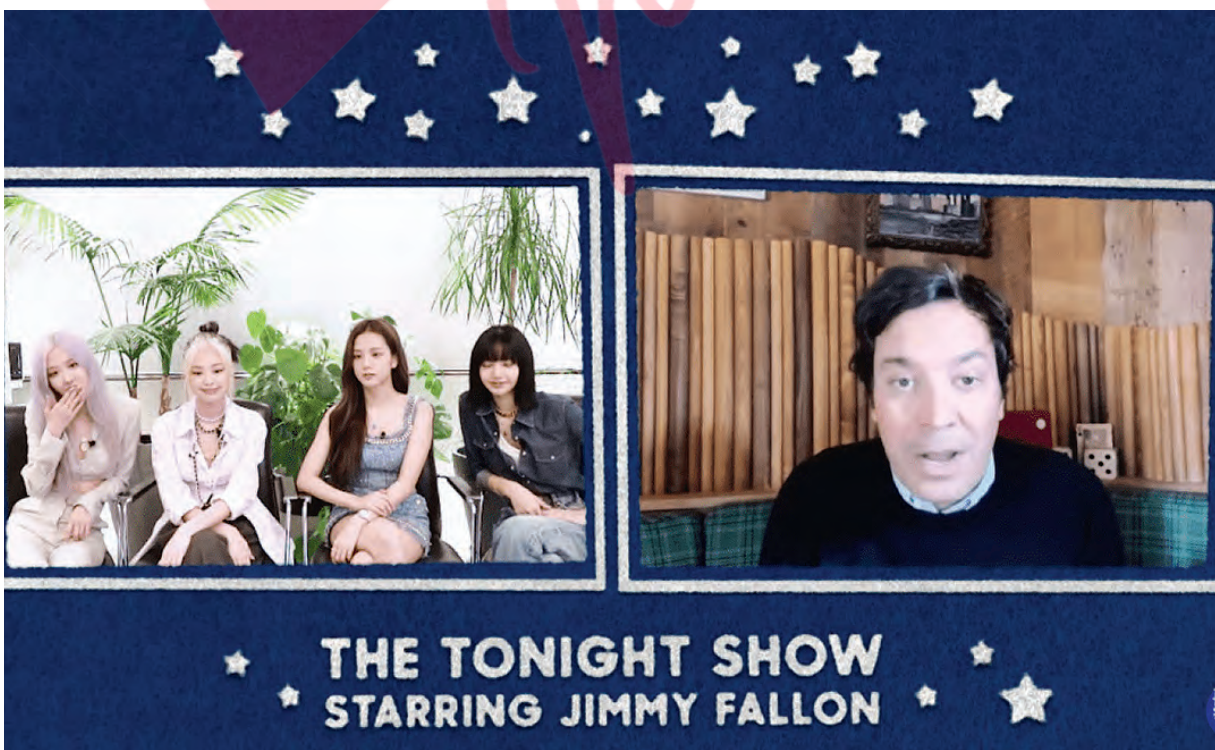
THE TONIGHT SHOW STARRING JIMMY FALLON

Tiga jarangan bioskop utama mengatakan akan membuka kembali bioskopnya di Amerika Serikat mulai 10 Juli dengan aturan jarak sosial yang ketat dan penonton film diharuskan memakai masker. (an/hdd)