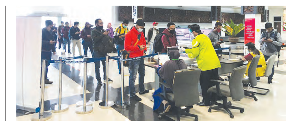
AKTIVITAS kedatangan penumpang di Bandara Kalimarau awal Juni lalu.

“Kami juga lihat kondisinya, dan kami akan segera turun melakukan perbaikan sementara. Dengan penimbunan yang rusak berat, dan penambalan aspal untuk yang rusak ringan,” tandasnya. (* /zuh/app/dnn/eny)