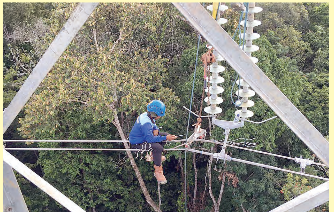
Pekerja PT PPP (Persero) Tbk sedang mengerjakan beberapa bagian untuk melengkapi proyek Pembangkit Listrik Tenaga Mesin Gas (PLTMG) Bangkanai Tahap 2 di Desa Karendan, Barito Utara, Kalimantan Tengah.

pembangunan, material bangunan dan konstruksi juga harus di datangkan melalui perjalanan laut dari Jakarta, Surabaya, dan Banjarmasin. Kemudian menempuh perjalanan darat ke Desa Karendan. Menurut Novel, PLTMG Bangkanai Tahap 2 diperuntukkan untuk memperkuat dan mengalirkan listrik di Kalimantan Selatan dan Kalimantan Tengah. Suplai listrik yang baik dan berkualitas akan meningkatkan aktivitas warga dan mendukung geliat ekonomi masyarakat. Saat ini, PP memiliki tujuh lini bisnis yang terintegrasi. Mulai dari hulu, middle stream , sampai dengan hilir. Yang meliputi energi, properti, infrastruktur, jasa konstruksi, EPC, peralatan berat, dan pracetak. Perseroan memiliki rekam jejak yang solid dan berhasil me-