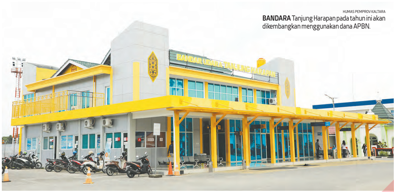
BANDARA Tanjung Harapan pada tahun ini akan dikembangkan menggunakan dana APBN.

rencana investasi kepada Presiden dan kementerian/lembaga terkait. Nantinya, diharapkan dapat difasilitasi oleh BKPM dalam pembahasannya di tingkat pusat. (hms/dnn/eny)