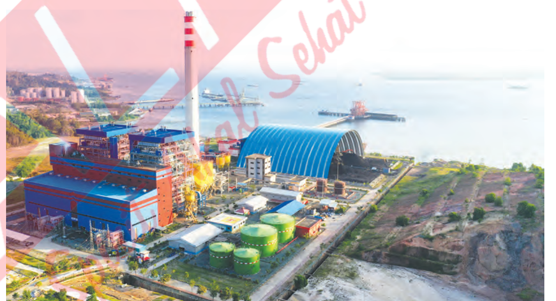
Pandemi COVID-19 turut menjangkit bisnis listrik akibat konsumsi sektor jasa yang menurun. PLN Kaltimra melakukan penyesuaian target konsumsi. Ilustrasi Pembangkit Listrik Tenaga Uap (PLTU) Kariangau.