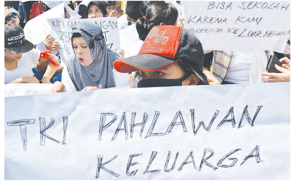
Para Tenaga Kerja Indonesia (TKI) di berbagai negara di dunia acap mendapatkan perlakuan tak senonoh dari atasannya. Berbagai kritik telah dilayangkan kepada pemerintah Indonesia. Namun kasus-kasus kekerasan terhadap TKI masih terus bermunculan.

diplomatis ke negara ataupun presiden. Agar secepatnya gajinya itu diperjuangkan," katanya. (pd/qn)