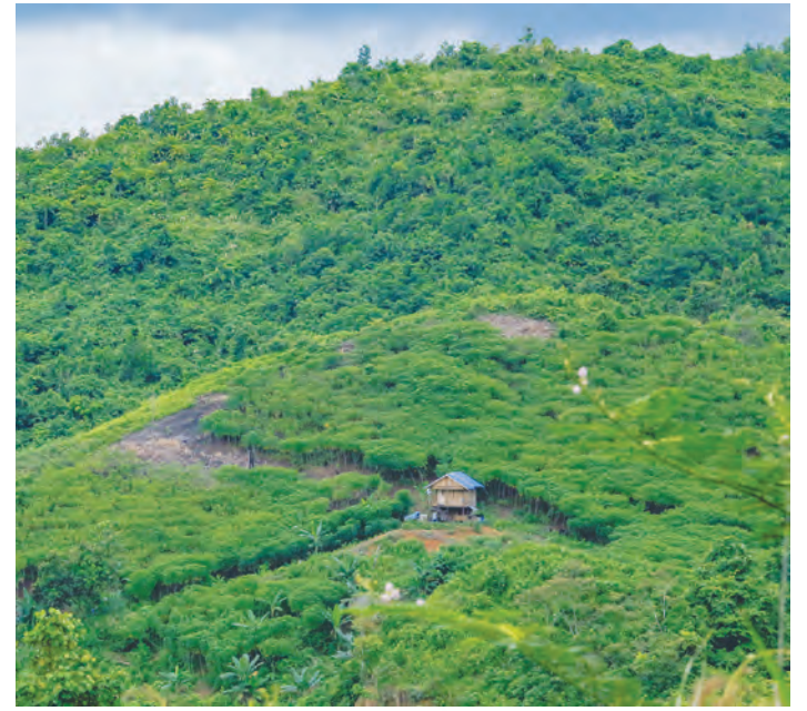
Lokasi IKN di Sepaku, PPU.

"Untuk mendapatkan persetujuan substansi dari Kementerian ATR. Nanti untuk menjadi perda dibahas lagi," ungkapnya. (ryn/hdd)