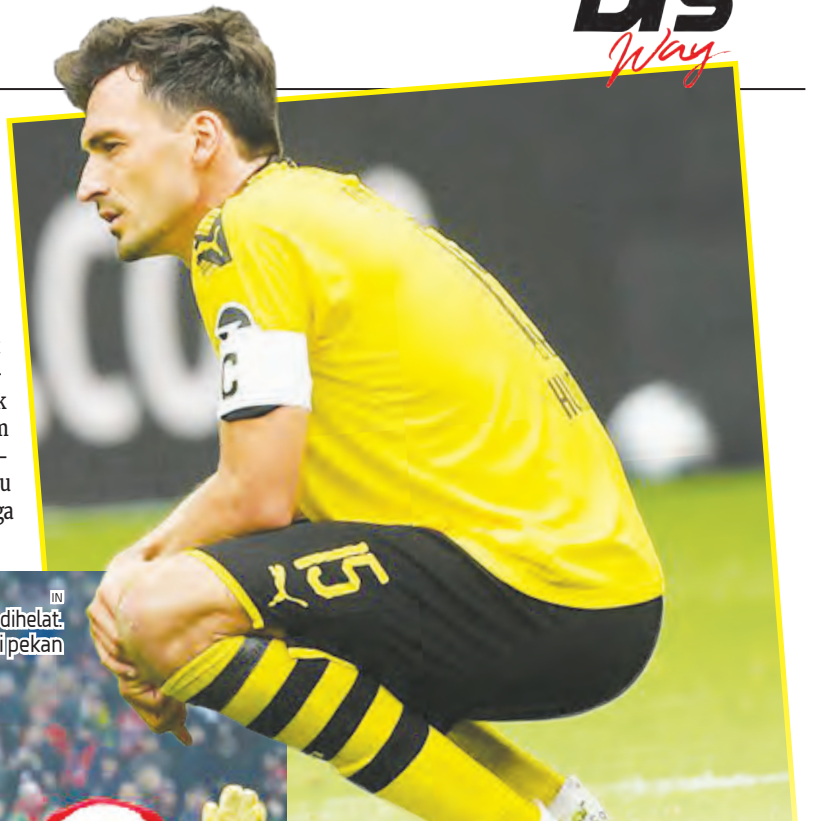
Bundesliga musim 2019/2020 telah selesai dihelat. Kebahagiaan dan kesedihan mewarnai pekan terakhir Liga Jerman kemarin.

menang 6-1 atas Köln, dan menduduki peringkat ke-16. Bremen akan memainkan laga play off untuk memastikan apakah musim depan mereka tetap bertahan di Bundesliga, atau justru kebalikannya, ke Bundesliga 2. Let,s see. (an/ava)