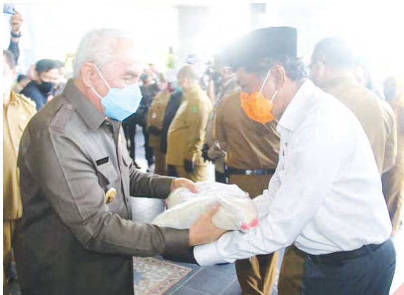
Wakil Bupati PPU Hamdam saat menerima bantuan CPP dari Gubernur Kaltim Isran Noor, Selasa (23/6) lalu.

berpotensi menjadi kluster baru penyebaran COVID-19," pungkask Bahauddin. (wal/eny)