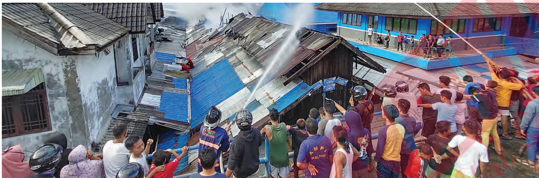
Petugas dan relawan tengah berjibaku melawan kobaran api di Pasar Segiri, Samarinda. Akses menuju titik api dan minimnya sumber air mengakibatkan proses pemadaman berlangsung hingga satu jam.

Anis belum mengetahui, jika satu kelurahan itu akan mendapatkan sesuai dengan jumlahnya. Karena data-data beras langsung dari Provinsi Kaltim. "Kita hanya menyalurkan saja," ungkapnya. (nad/dah)