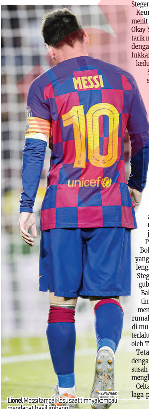
Lionel Messi tampak lesu saat timnya kembali mendapat hasil imbang.

Hasil itu untuk sementara mengangkat posisi Barcelona ke puncak klasemen dengan koleksi 69 poin, tetapi Real Madrid (68) bisa menyialip jika memenangi pertandingannya pada Minggu (28/6) waktu setempat (Senin Wita).