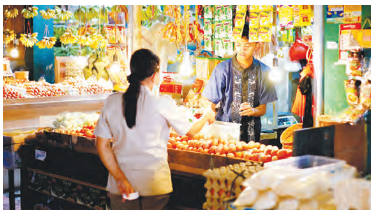
Suasana aktivitas transaksi jual beli di salah satu pasar di Balikpapan.

Polri akan meningkatkan kerja sama lintas sektoral. Kemudian, sosialisasi dan edukasi bersama stakeholder. "Kami koordinasi intensif dengan Tim Gugus Tugas di daerah," tutupnya. (bom/hdd)